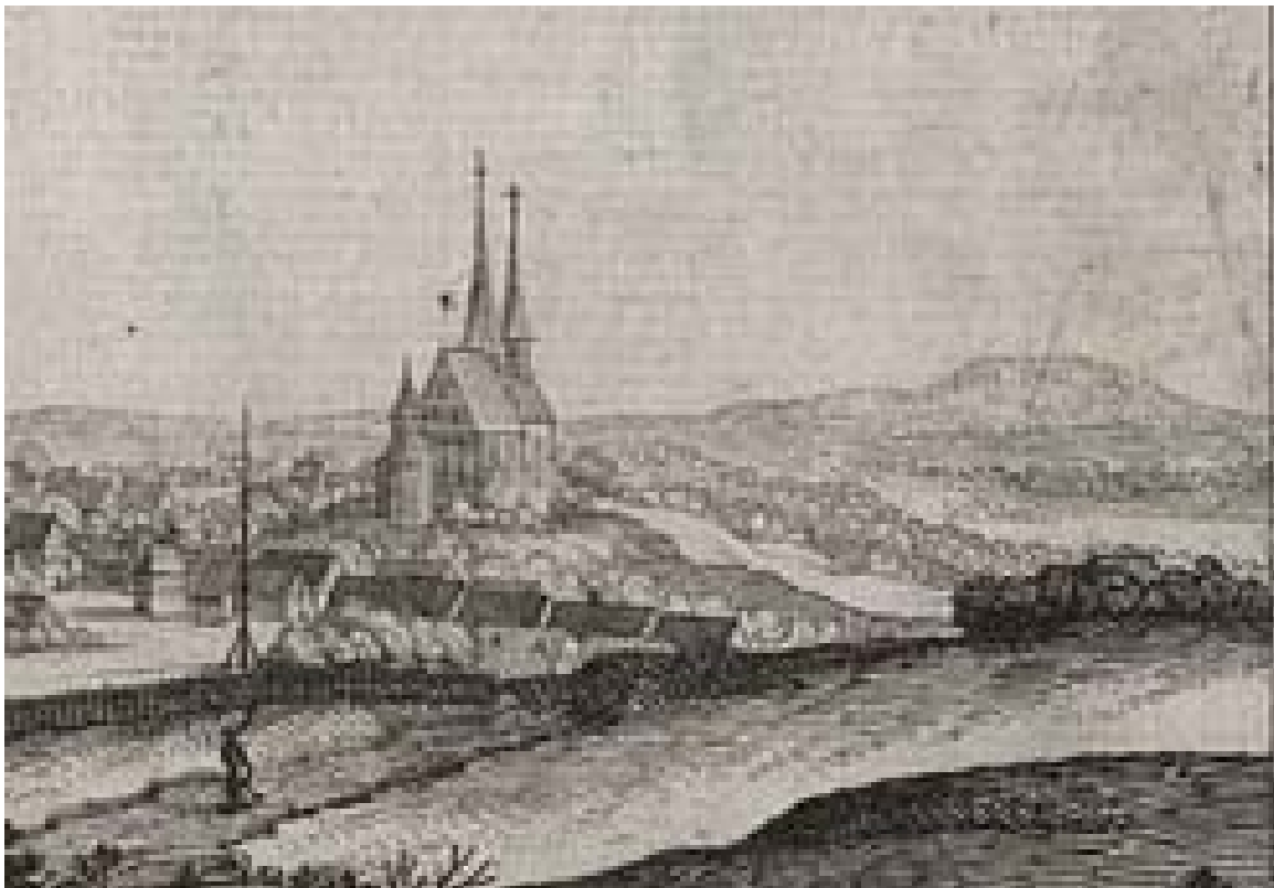
Panoramabild von Geithain (Ausschnitt) des Merian: Topographia Saxoniae superioris; 1655: vor der Marienkirche stehen die Häuser in der Bruchheimer Straße, rechts der Kirche stehen die Häuser in Wickershain am Hang, im Hintergrund der Rochlitzer Berg (nicht perspektivisch gezeichnet)

Darüber hinaus waren alle zur Frohn für die beiden Geithainer Fürstenteiche pflichtig, schon jahrhundertlang, wie aus einer Urkunde des Landesherrn aus dem Jahr 1339 hervorgeht. Als am 4. November 1569 der Rat der Stadt die Teiche vom Landesherrn kaufte, blieb es dabei, obgleich die Stadt keine landesfürstlichen Rechte besaß. In „winnter zeit mussen sie vff des fischmeisters anweissung vnd geheiß auff solchen teichen“ tätig werden. Allerdings hat der Rat auf seine Kosten die Leute und die Pferde verköstigen müssen. Diese Pflichten endeten im Jahr 1598. Aber am 14. März 1698 werden vom Kurfürsten diese Frohnarbeiten erneuert wie folgt: „Weiln auch die Einwohner zu Wickershan vermöge ihrer alten Brieffe zu solchen Deichgebäude alle nothurfftige Fuhren mit Pferden und der Hand daran dienen.“ Am 21. Januar 1780 wurde dem Dorf ein sog. Freiheitsbrief ausgestellt, der die Bauern von den Hand- und Spanndiensten freistellte, 1698 waren sie vom Kurfürsten August d.Starken der Stadt noch einmal bestätigt worden. (Man beachte: nicht „Frohndienst“, falsch wie „Weißer Schimmel“).